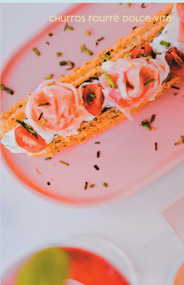
churros fourré dulce-vita