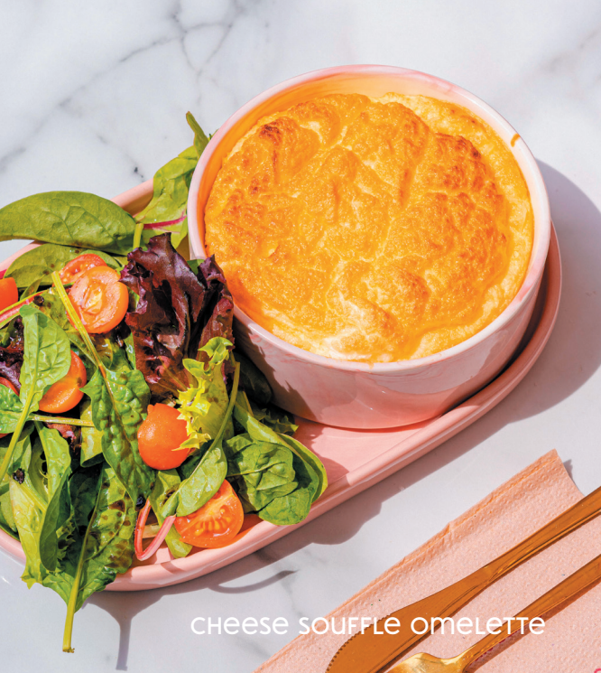
CHEESE SOUFFLE OMELETTE