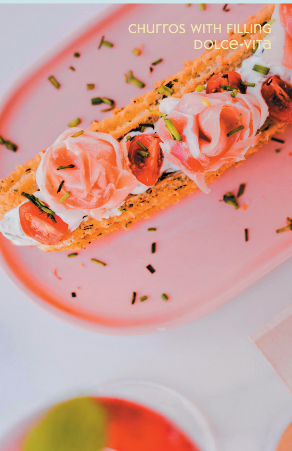
CHURROS WITH FILLING DOLCE-VITA