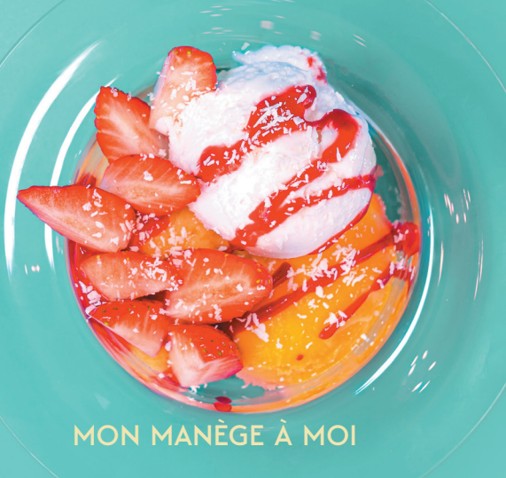
MON MANÈGE À MOI