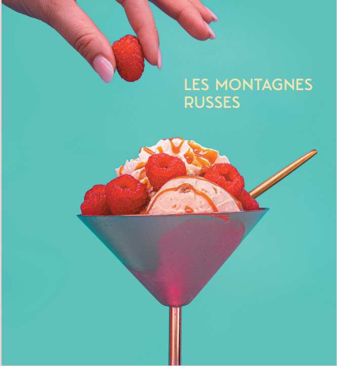
LES MONTAGNES RUSSES