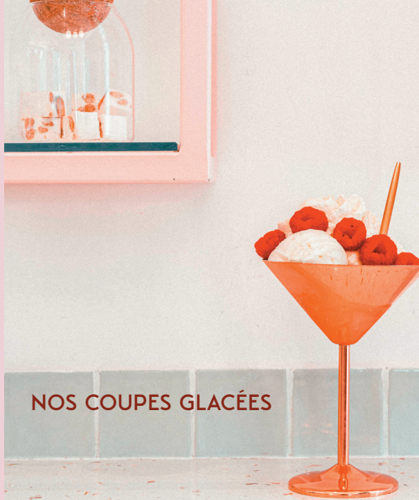
NOS COUPES GLACÉES