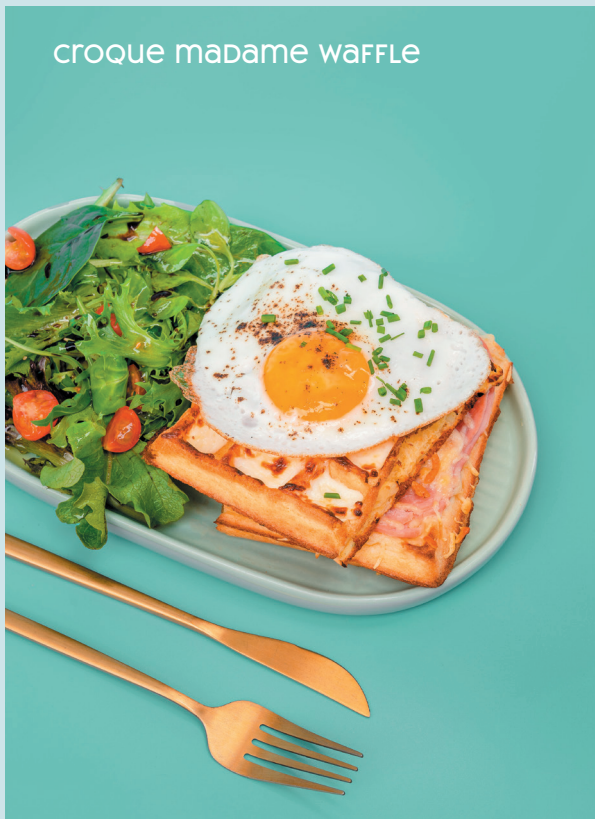
CROQUE MADAME WAFFLE