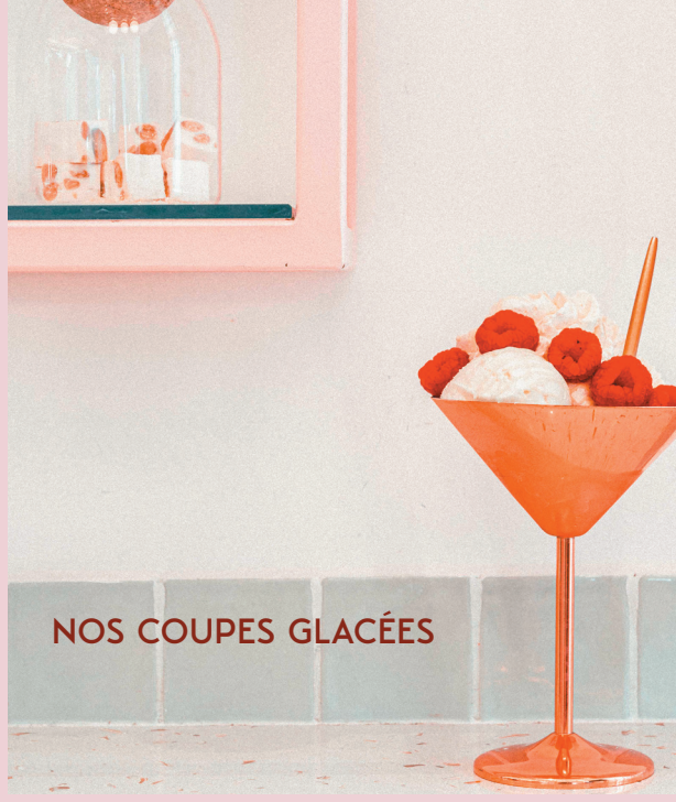
NOS COUPES GLACÉES