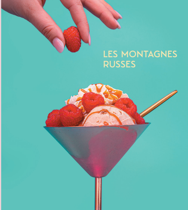
LES MONTAGNES RUSSES