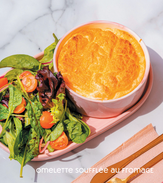
omelette soufflée au fromage