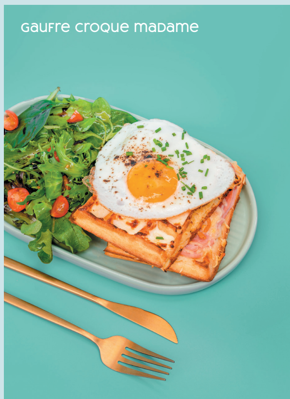
gaufre croque madame