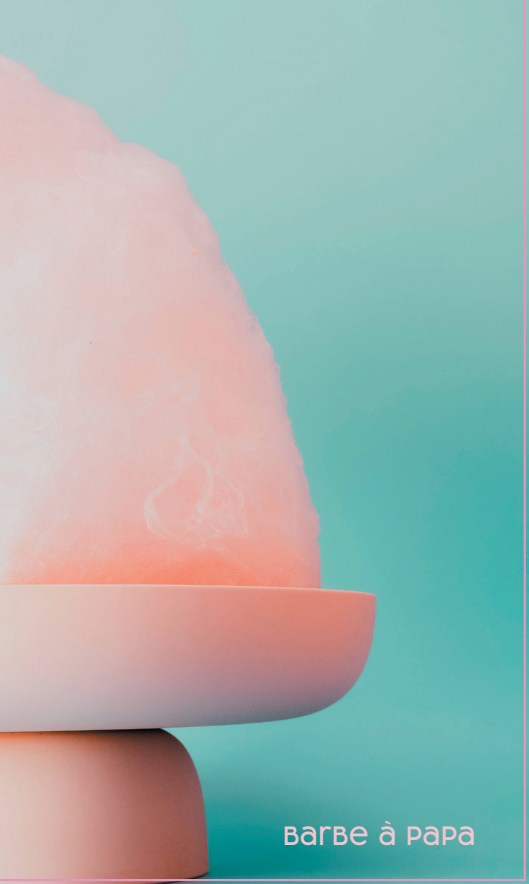
BARBE à PAPA