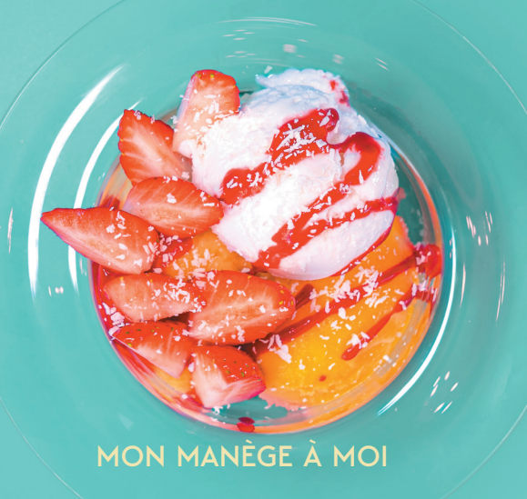
MON MANÈGE À MOI